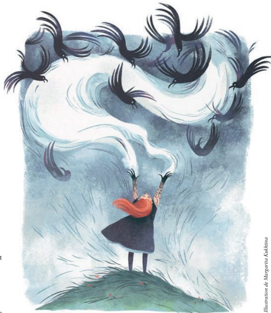
Illustration de Margarita Kukhina